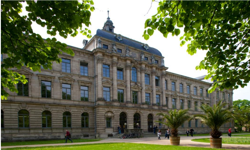
Campus FAU, Erlangen

Erlangen es una ciudad que cuenta con aproximadamente 106.000 habitantes. La Friedrich-Alexander Universität (FAU) fue fundada en 1743 y es una de las más grandes universidades en Alemania con 40.174 estudiantes. Una gran parte de las materias se dan en inglés a nivel de estudios superiores. Erlangen se presenta como ciudad multicultural con habitantes de más de 140 países diferentes. Gracias a esa diversidad, Erlangen ofrece también una vida cultural muy cosmopolita.